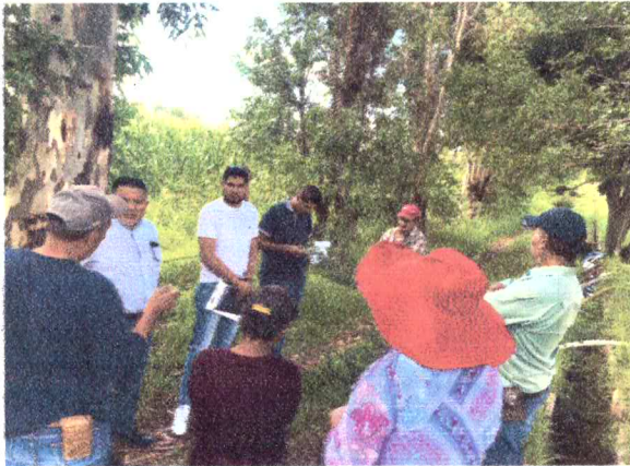
SOLUCIÓN CALLE INVADIDA COMUNIDAD DEL ANCÓN