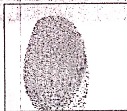
HUELLA DACTILAR (PULGAR DERECHO)