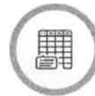
Tabla de aplicabilidad