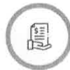
Información anterior al 2017