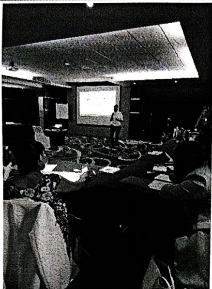
Presentación realizada por Responsable Estatal del Programa de Violencia de Género