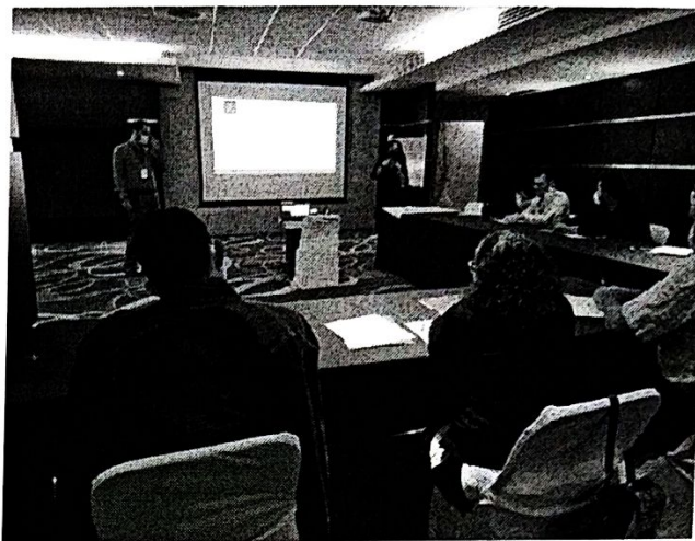
Tema: Marco Legal