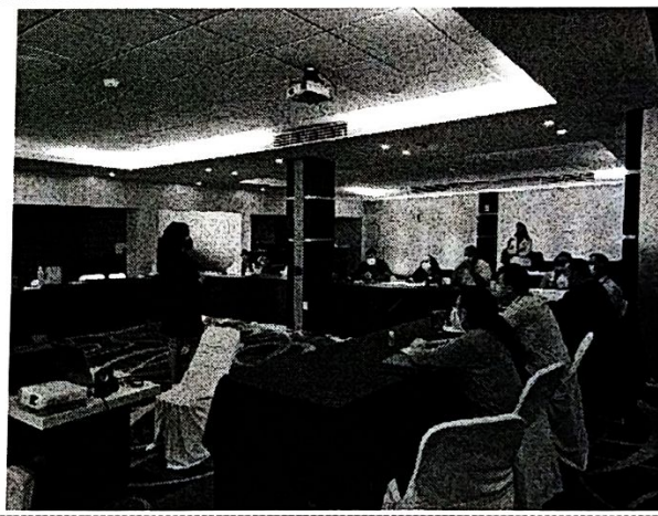
Revisión de alcance de expectativas Acuerdos y compromisos