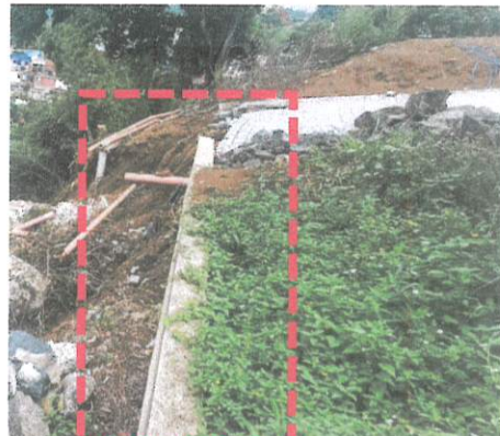
FOTO 5 Y 6: Estructura de contención carente de diseño y dimensiones adecuadas.