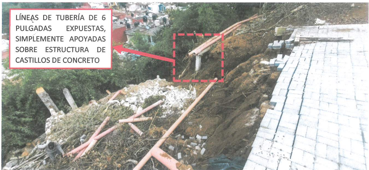
FOTO 1: Condiciones encontradas el día de la inspección física del lugar de los hechos.

El deslizamiento de tierra referido fue causado principalmente por el exceso de agua que fluía desde la calle superior del fraccionamiento hacia el área de equipamiento urbano, agravándose debido a una falla en el sistema de drenaje del fraccionamiento citado, el cual también recibía aportación de agua pluvial, generando un gasto superior a la capacidad de la tubería existente, misma que se percibe de un diámetro de 6 pulgadas, expuesta y simplemente apoyada sobre una estructura de castillos de concreto de 15 x 20 cm, la cual no le proporcionaba suficiente estabilidad (FOTO 1).