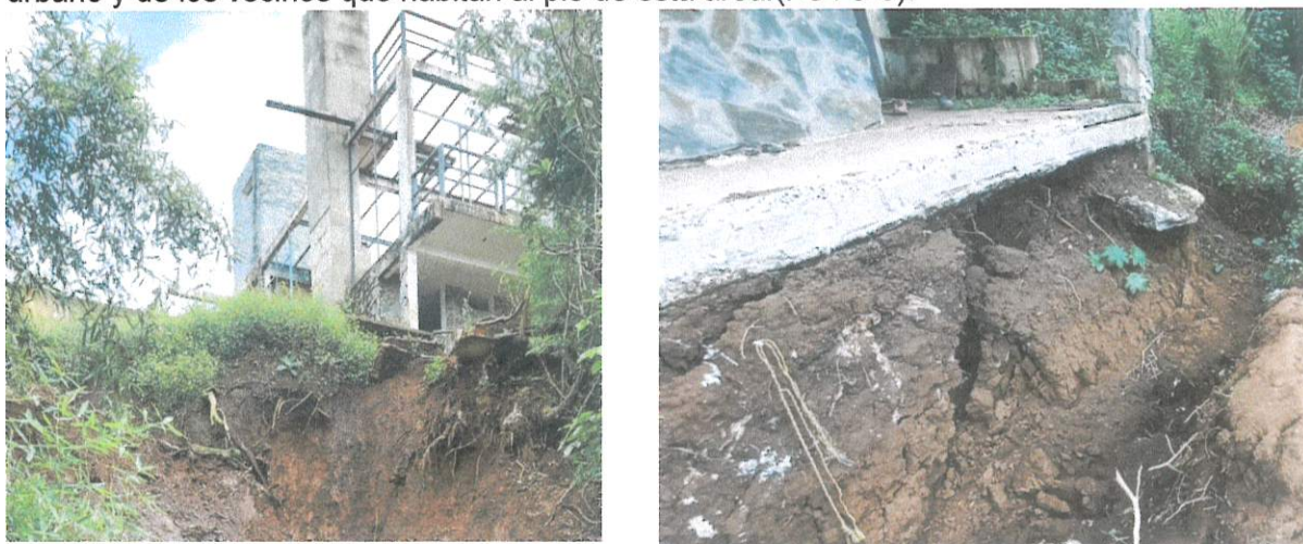
FOTO 9: Edificación perteneciente al fraccionamiento al borde del talud, carente de estructura de cimentación.

Se observó una edificación ubicada en el borde del talud sobre el área del fraccionamiento, la cual no cuenta con una estructura de contención y cimentación adecuada, aparentando haber sido construidas sin respetar las normativas técnicas, incrementando el riesgo de colapso hacia el área de equipamiento urbano y de los vecinos que habitan al pie de esta área.(FOTO 9).