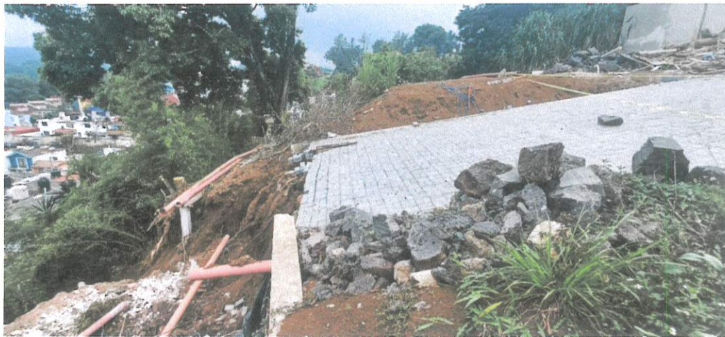
FOTO 4: La ausencia de un sistema de infraestructura adecuado para captar aguas pluviales favorece que estas escurran naturalmente hacia el área de equipamiento urbano debido a la pendiente del terreno.

La obra de vialidad y alcantarillado en el predio ubicado en la calle Diana Laura Riojas No. 120 carece de sistemas de drenaje pluvial, como traga tormentas o alguna salida de agua controlada, lo que provocó que el agua superficial se acumulara al escurrir superficialmente por la vialidad del fraccionamiento sobrepasando el nivel de la corona del muro de contención, debilitando su base y al suelo donde se desplanto. Esta falta provocó el deslizamiento de la estructura al no existir una obra complementaria que gestionara el exceso de agua de manera eficiente (FOTO 4).