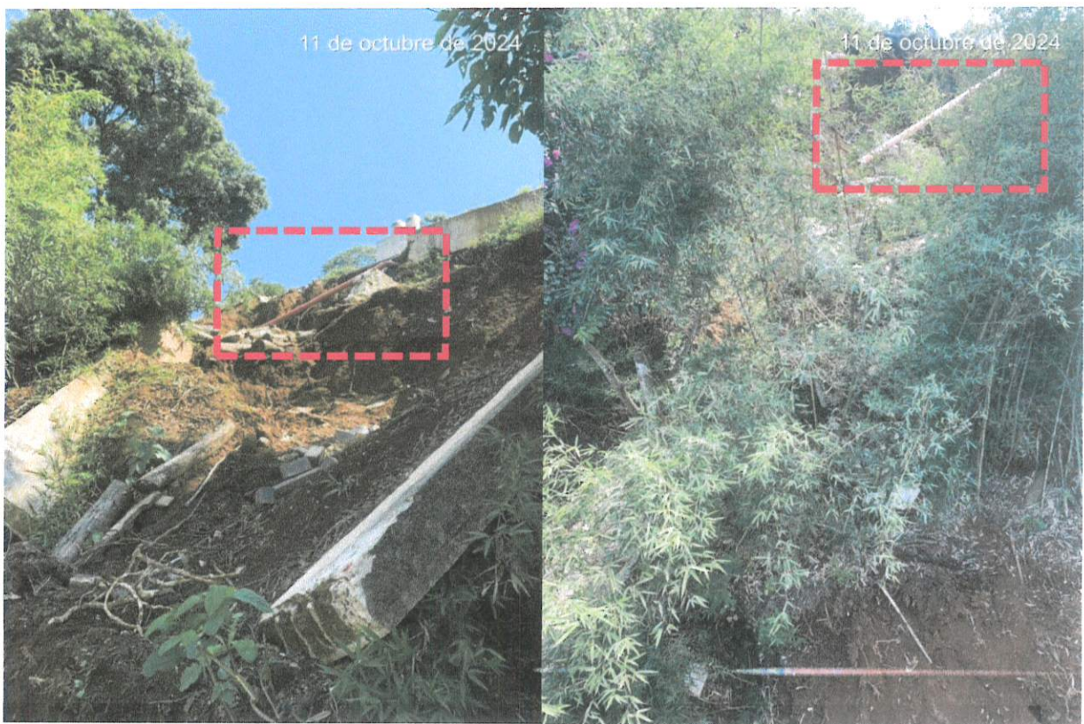
FOTO 2 Y 3: La línea de drenaje se encuentra operativa tras el deslizamiento ocurrido continúa descargando hacia el área de equipamiento urbano.

Como se describió anteriormente, se detectaron dos líneas de tubería de alcantarillado tipo PVC de 6 pulgadas, soportadas por una estructura inadecuada de castillos de concreto de 15 x 20 cm, expuestas superficialmente, lo que no cumple con la norma de diseño según lo que marca la ficha técnica de la tubería, estando conectadas a registros que canalizan el drenaje hacia la calle Olmecas. A pesar de las irregularidades observadas, las tuberías continuaban en funcionamiento en el momento de la inspección (FOTO 2 Y 3). Siendo la falla del drenaje uno de los factores críticos que contribuyeron a la saturación del suelo, ya que, además de transportar aguas residuales, también recibía aportaciones de agua pluvial, concentrando el flujo en una sola descarga.