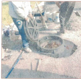
COLOCACION DE TAPA DE POLIETILENO DE USO RUTERO KM 15+000