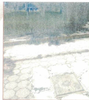
SECCION GENERADO POR DESCARGA DOMICILIARIA EN LA CALLE ALLENDE