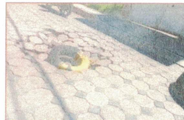
SECCION GENERADO POR DESCARGA DOMICILIARIA EN PERIODO FCO. I MADERO

Plaza Principal, S/N. Primera Sección, C.P. 90780, Xicohtzinco, Tlaxcala, Tlax.