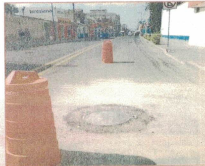
BACHEO Y RENIVELACION DE TAPAS EN CARRETERA FEDERAL PUEBLA TLAXCALA KM 16+200