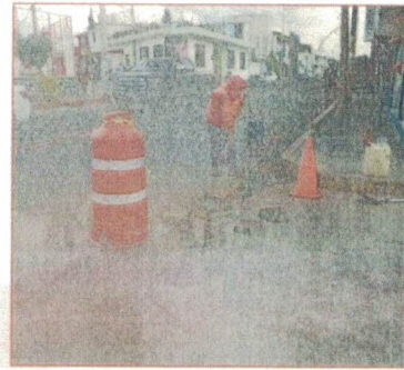
COLOCACION DE TAPA DE POLIETILENO DE USO RUTERO KM 15+000