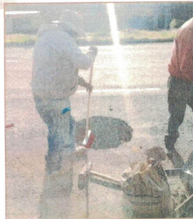
TRABAJOS DE PREPARACIÓN PARA EL ASENTAMIENTO DE NUEVA, EN KM. 15+000