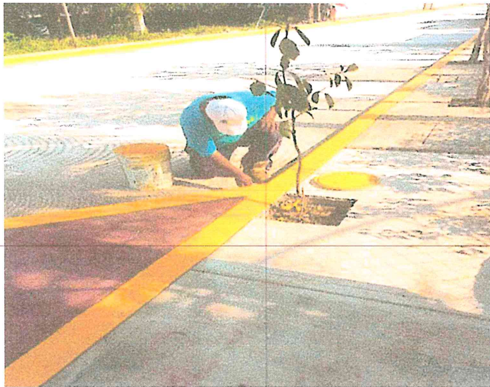
PAVIMENTO CALLE 16 AV. 4 Y 6