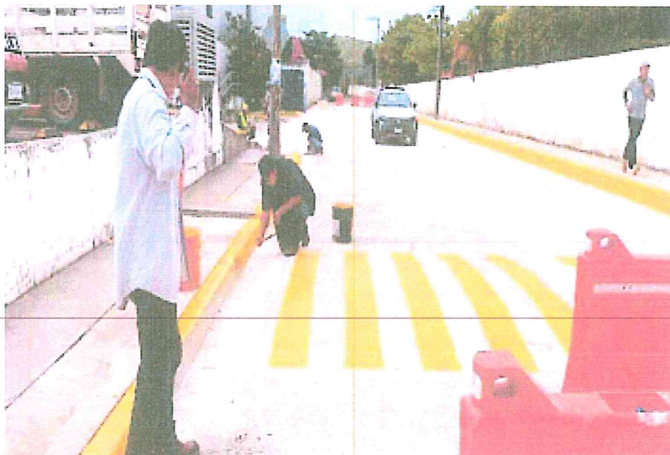
PAVIMENTO SAN FRANCISCO, MATA CLARA.