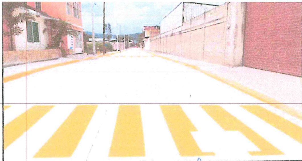
PAVIMENTO CALLE 6 ENTRE AVS. 5 Y 9.