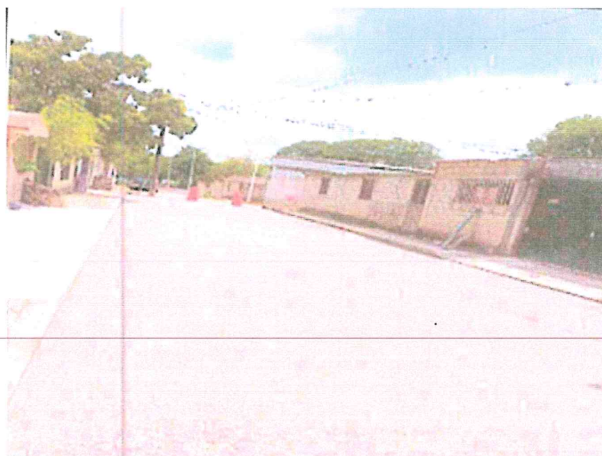
PAVIMENTO EN 2DA. DE CALLE 15 COL. ALTAMIRANO