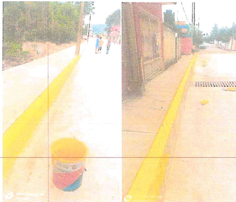
PAVIMENTO CALLE 9 ENTRE AVS. 6 Y 10